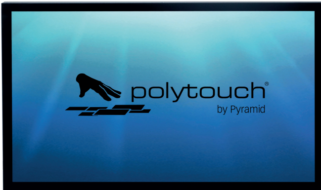
Abbildung zeigt Ausstattungsvariante