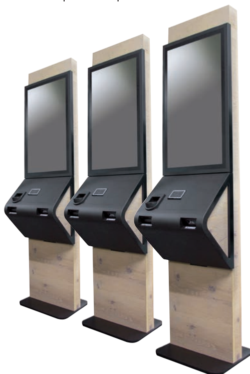
Abbildung zeigt Ausstattungsvariante