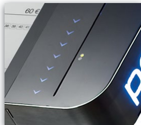
Intelligente LED Benutzerführung