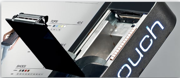
80x80mm POS Thermodrucker