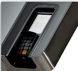
Verifone VX820 Chip & PIN Zahlung