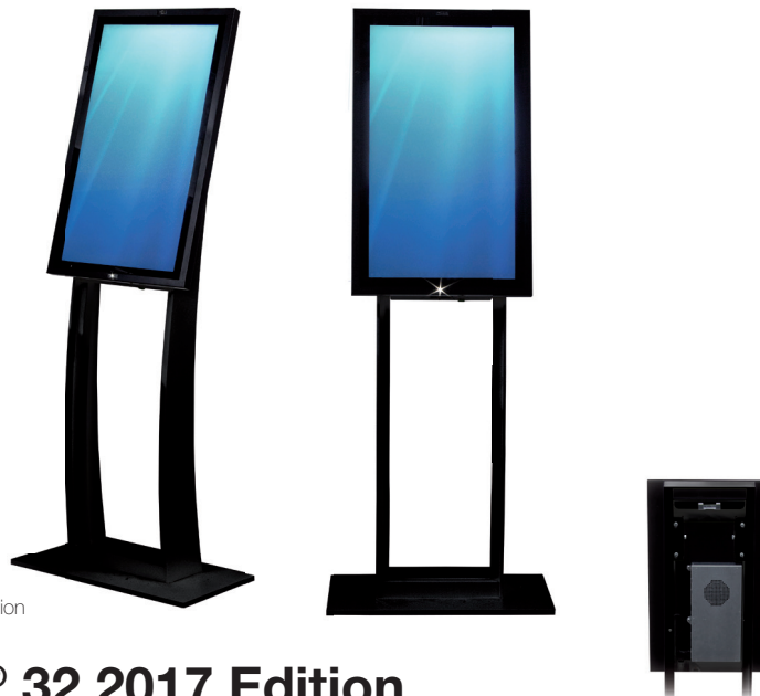
polytouch® 32 2017 Edition