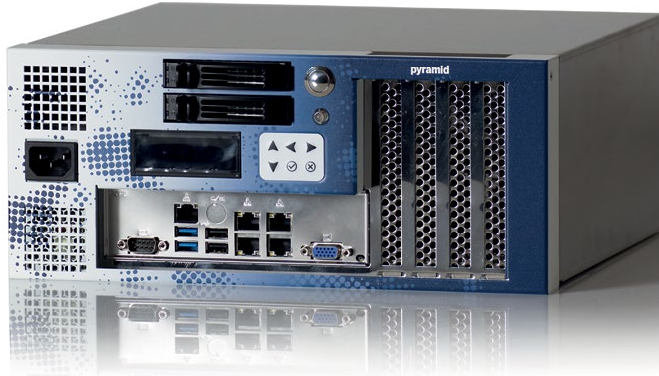
Abbildung zeigt Ausstattungsvariante