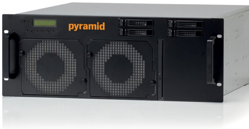
Abbildung zeigt Ausstattungsvariante