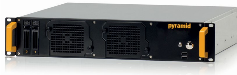
Abbildung zeigt Ausstattungsvariante