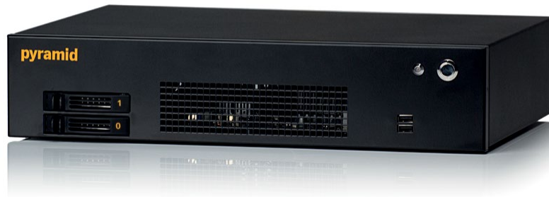
Abbildung zeigt Ausstattungsvariante