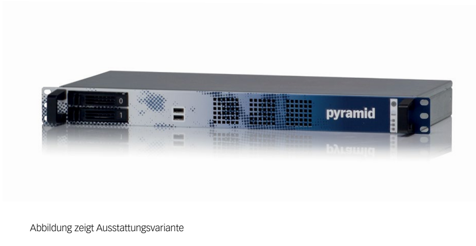
Abbildung zeigt Ausstattungsvariante