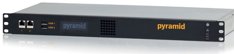
Abbildung zeigt Ausstattungsvariante